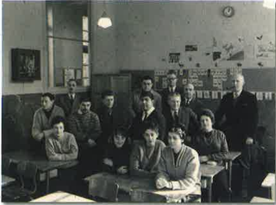
Les instituteurs 1962/1963

Plaque apposée le 29 mai 1921 rappelant qu'en 1914, un des artilleurs cantonnés dans cette école fut à l'origine du succès de la chanson la Madelon, qui devint « l'hymne des Poilus ».