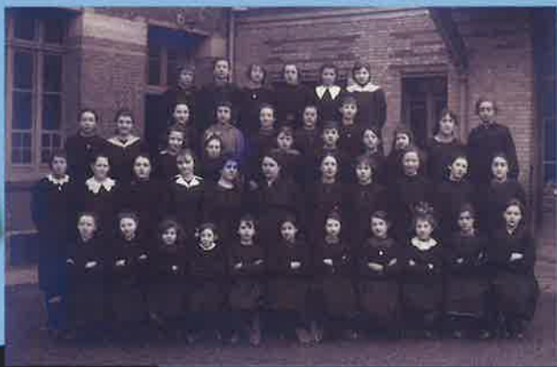
Classe de filles 1916/1917