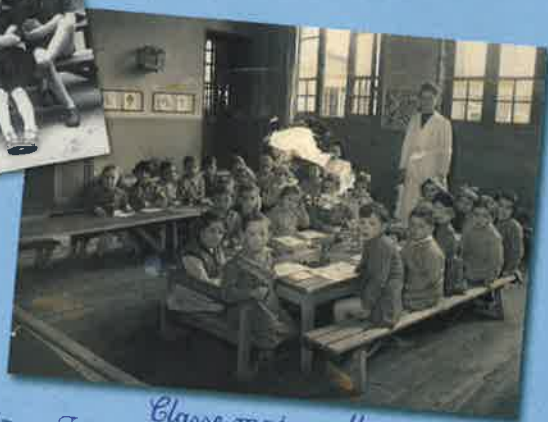
Classe maternelle 1953/1954