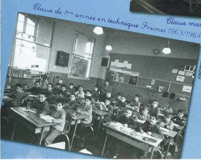
Classe de 1 ère année en technique Freinet 1963/1964