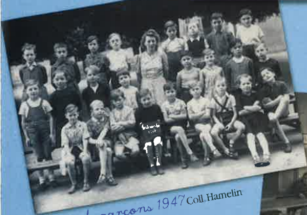
Classe de garçons 1947 Coll. Hamelin